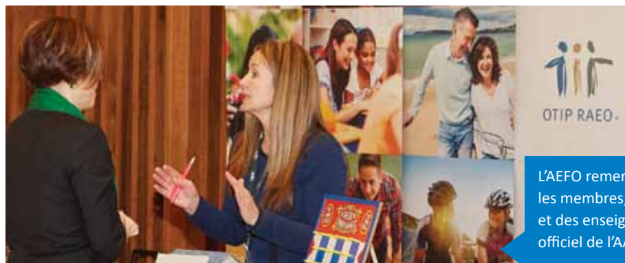
L'AEFO remercie les exposants qui sont venus rencontrer les membres, dont le Régime d'assurance des enseignantes et des enseignants de l'Ontario (RAEO), le commanditaire officiel de l'AA. Le RAOE célèbre 40 ans cette année.