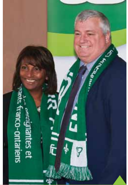
La ministre de l'Éducation, l'honorable Indira Naidoo-Harris (photo ci-haut), a fièrement porté les couleurs de l'AEFO, ainsi que la porte-parole du nouveau Parti démocratique de l'Ontario en matière de l'éducation, Peggy Sattler (photo de gauche). On les voit ici accompagnées du président de l'AEFO, Rémi Sabourin.

Pour sa part, la porte-parole du Nouveau Parti démocratique de l'Ontario en matière d'éducation, Peggy Sattler, a affirmé que son parti, s'il est élu aux prochaines élections provinciales en juin, mettrait fin aux tests standardisés de l'Office de la qualité et de la responsabilité en éducation (OQRE) et miserait plutôt sur des évaluations par échantillonnage.