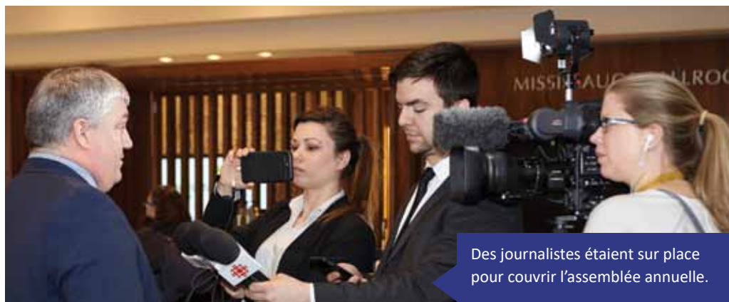
Des journalistes étaient sur place pour couvrir l'assemblée annuelle.