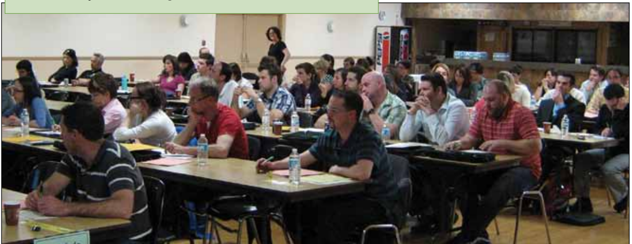
Un moment de réflexion et d'écoute pour les membres de l'unité 65.