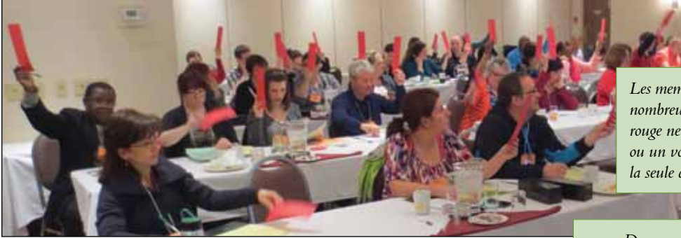
Les membres de l'unité 64 lors de l'un des nombreux votes. À noter que le carton rouge ne signalait pas un vote « pour » ou un vote « contre », le rouge ayant été la seule couleur utilisée lors des votes.