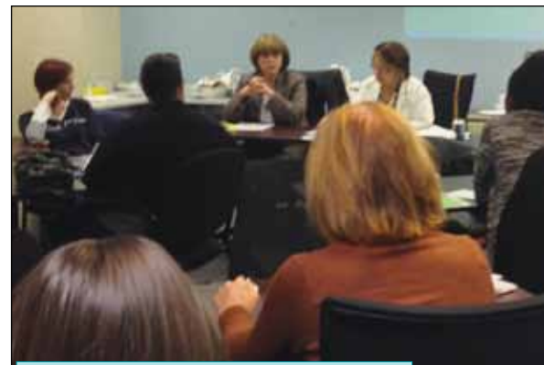
Les membres de l'unité 203-CPS prennent connaissance de l'entente de principe avant le vote de ratification le 10 octobre.